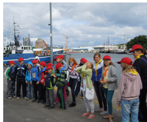
W sierpniu, wychowawcy ze świetlicy parafialnej, zorganizowali dla 35 dzieci kolonię w Ustroniu Morskim. Przez dwa tygodnie świetlicowa wspólnota i ministranci, wypoczywali nad morzem.